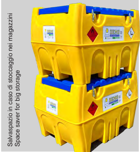
Salvaspazio in caso di stoccaggio nei magazzini Space saver for big storage